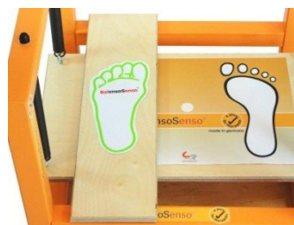
Ausgleichsbrett zur Teilbelastungsrealisierung