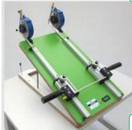
Extension Flexion Schulter- Ellbogengelenk