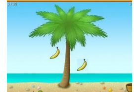
Übungen zur Motorikschulung