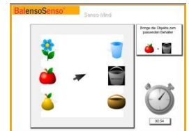
Übungen zur Gedächtnisleistung