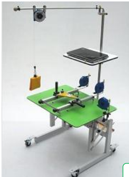
Multi Board Tisch

Gruppentherapie effizient und wirtschaftlich