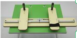
Schulter Ab- & Adduktion