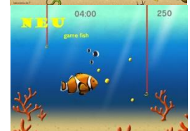
Übungen zur Förderung der Wahrnehmung