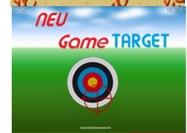
Therapiespiele für Fein- und Grobmotorik