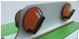
Pro-Supination Hand & Ellbogengelenk